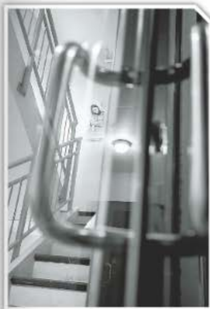
INNGANG: Sogn barnevern held til i etasje av var legesenteret.

Det var heller ikkje akseptert å vere på «feil» side. Kva som var rett og feil side, blei definert