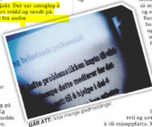
GÅR ATT: Ikkje mange gladmeldingar.