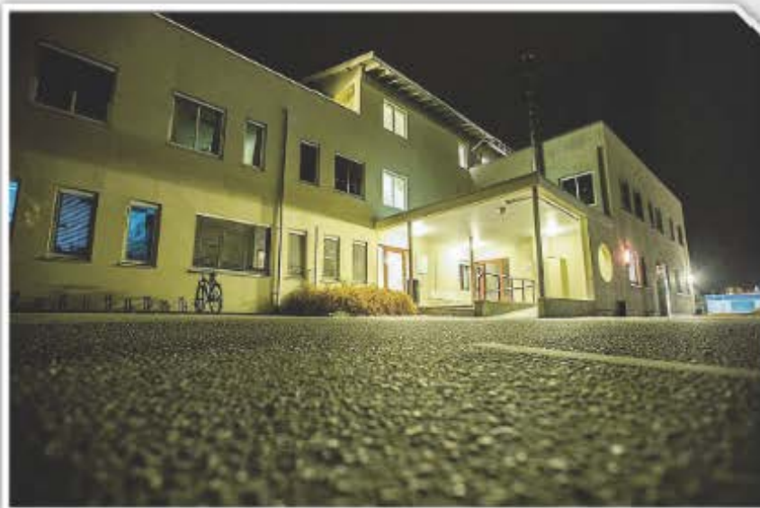
TRIST: Dei fortel om mange tunge stunder i dette bygget, dei som ikkje orka meir av leiinga i Sogn barnevern.

«Han skjelte meg ein gong ut for alle i personalmøte. Då eg konfronterte han med kvifor han ikkje tok opp ting med meg på tomannshand, så la han skulda over på meg, nesten som eg hadde bedt om kollektiv utskjelling. Det har over tid blitt skapt ein