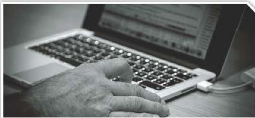
DOKUMENTAR: Sogn Avis har brukt mykje tid på denne dokumentaren.

– Eg syntest eg gjorde ein dårleg jobb. Sjølv om eg gav beskjed til leiari fekk eg berre nye oppgåver og saker. Plutselig sat eg på kontoret og ønska at eg vart sjuk slik at eg kunne få fri. Den hausten vart eg sjuk, eg fekk kreft. Då anga eg bittert på tankane mine. Då eg kom att frå sjukmelding var ting byrja å skje. Arbeidstilsynet kom og me starta endingsprosessen,