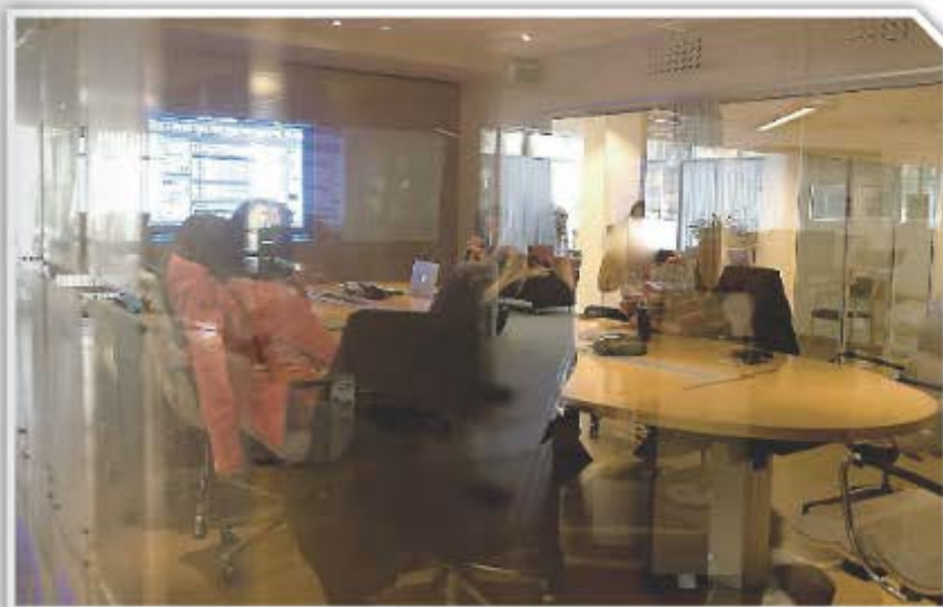
MOTE: Sogn Avis har hatt mange møte med tilleggsrå tilsette i barnevernet.

Ho peikar på at det står i Menneskerettighetene Artikkel 19, «enhver har rett til menings- og yringsfrihet» . Denne rett omfatter frihet til å hevde meninger uten innblanding, og til å søke, motta og meddele opplysninger og ideer gjennom ethvert meddelelsesmiddel og uten hensyn til landegrensar. «I Sogn barnevern blei ikkje denne artikkelen lagt vekt på. Leiinga skapte sider. Det var to sider. Rett eller gale. Det var ikkje akseptert å stå i mellom, då blei du pressa til å ta side.