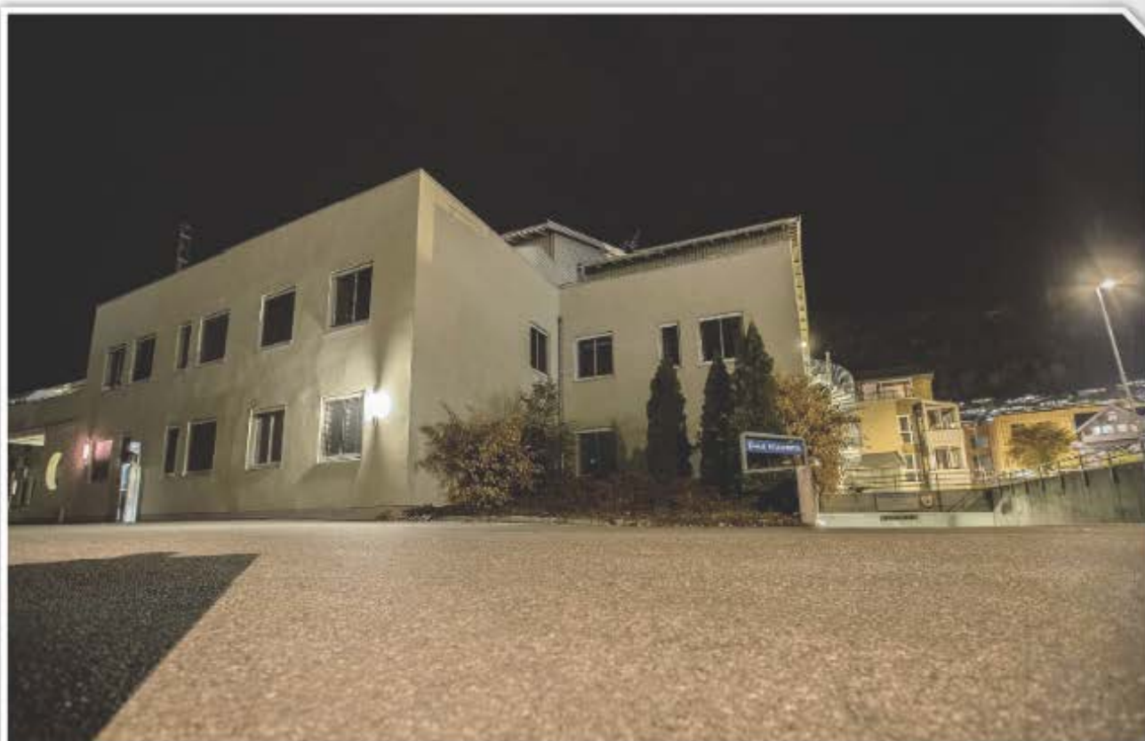
HELSESENTER: I dette bygget har Sogn barnevern halde til heilt sidan opprettinga i 2008.