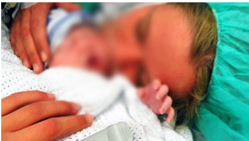
Den unge moren fikk bare en time sammen med babyen sin.

Tingretten mente at den sakkyndige psykologens rapport var for ensidig negativ mot moren. Det var ikke bevist at hun manglet omsorgsevne. Dermed måtte den lille jenten bryte opp igjen, denne gangen fra fosterhjemmet.