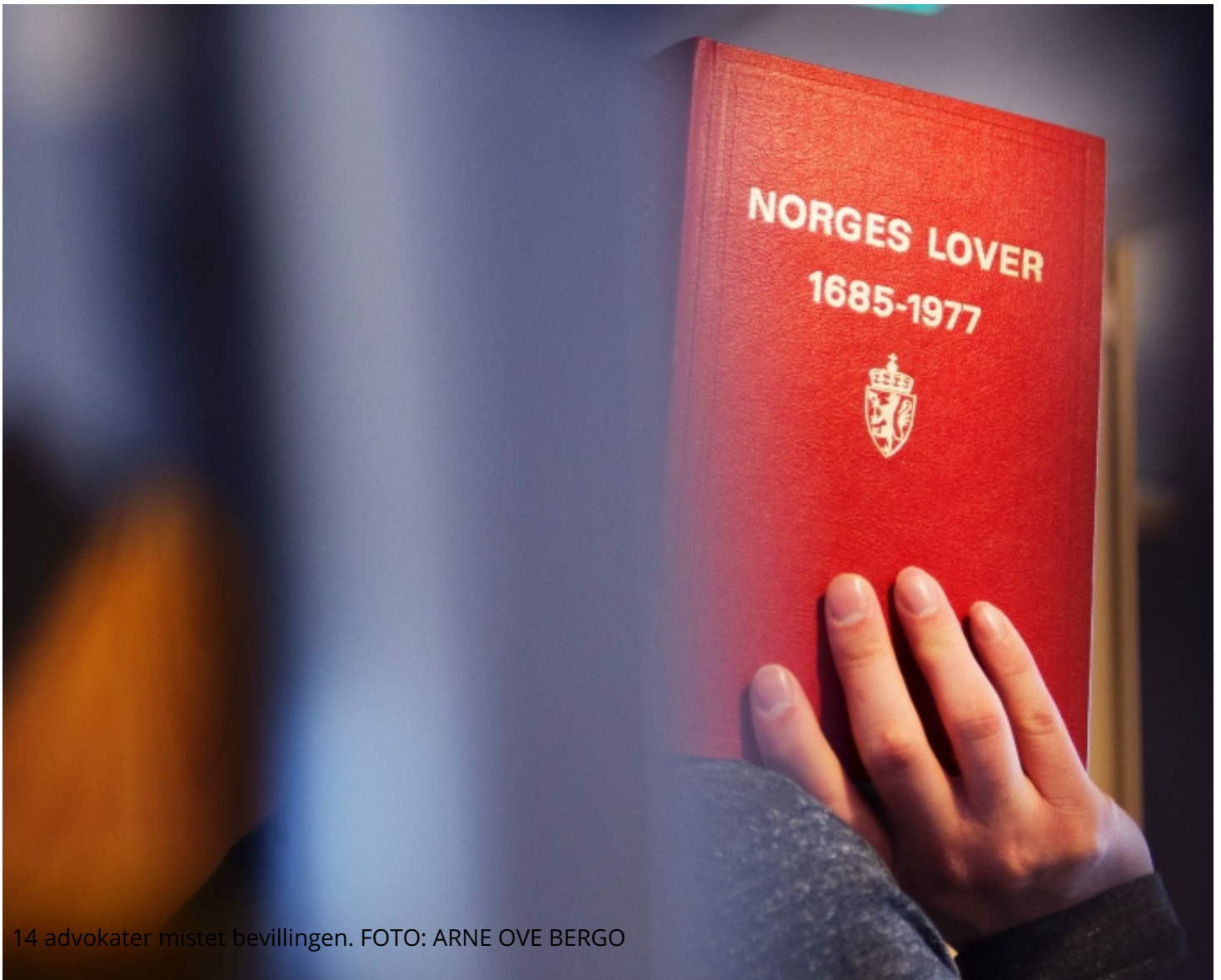
14 advokater mistet bevillingen.

Geir Rakvaag: Russeluene med alle sine krav til knuter er blitt et frer