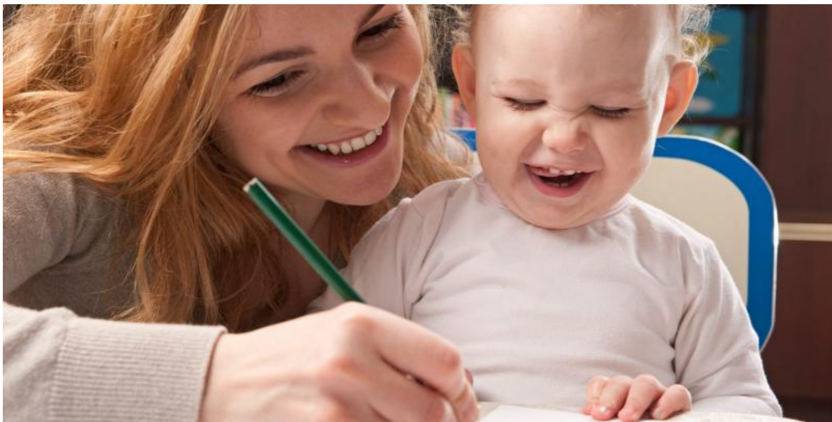
ALLTID LIKE FLINK: Å skryte av at barnet er flink til å tegne, føles meningsløst for barnet, sier psykolog.