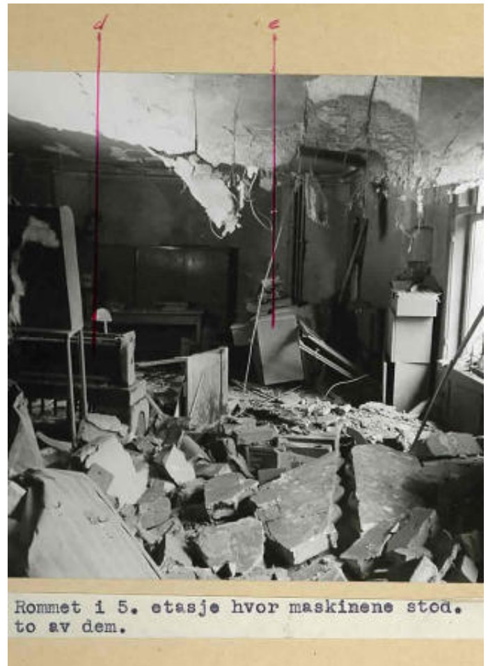
EKSPLOSJONEN I GRENSEN 17: 8. juni 1944 sprengte motstandsbevegelsen et NS-kontor i Oslo sentrum. Meningen var å ødelegge registreringsmaskinene som skulle benyttes til å holde styr på norske ungdommer som skulle innkalles til krigstjeneste.

Bare Bjerkås-arkivet utgjør omlag 1,4 hyllemeter og 10 000 sider, blant annet alle hennes prekner som prest.