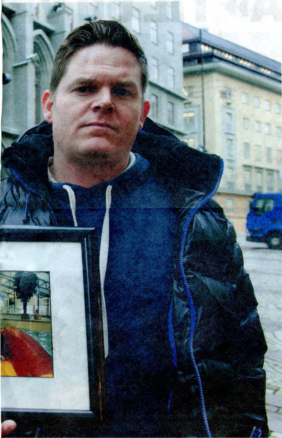
ha kontakt med henne.