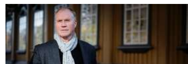
Ola By Rise blir ny kommunaldirektør