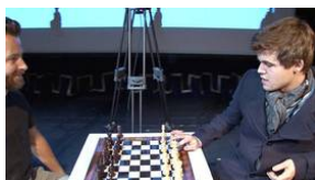
Magnus Carlsen: - Dorsin er en bonde