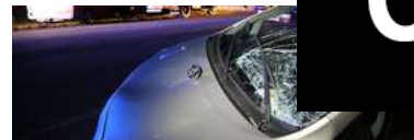
Kvinne skadd etter elgpåkjørsel