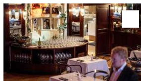
Nytelse i ni akter