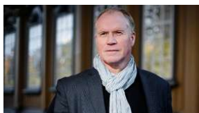
Ola By Rise blir ny kommunaldirektør