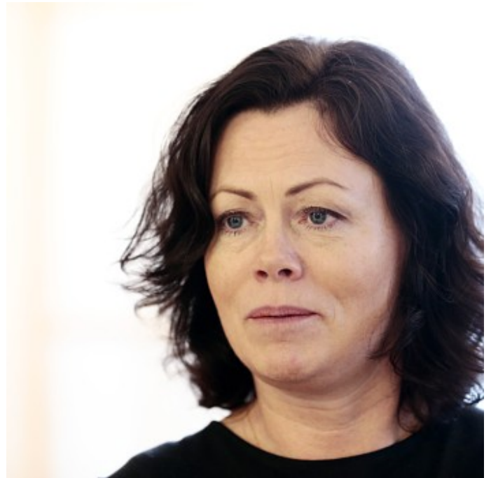
ENDRET PRAKSIS: Barneminister Solveig Horne gjorde endringer i praksisen etter NRKs Brennpunkt-dokumentar.