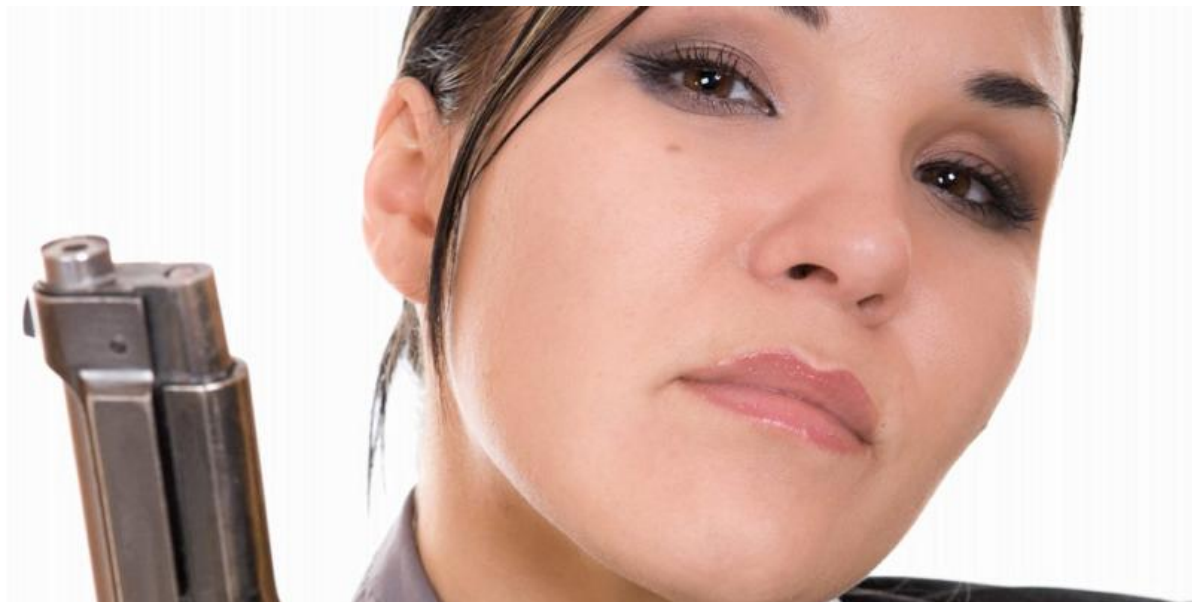
EMOSJONELT BLIND: Man kan si at psykopatene er emosjonelt fargeblinde. De vet om fargen rød og hvor den forekommer, men er ikke i stand til å oppleve den selv.