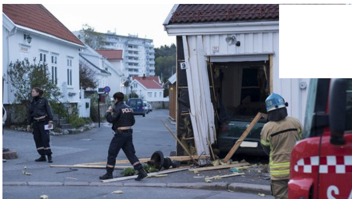
Smadret hus med bil - hadde 1,94 i promille