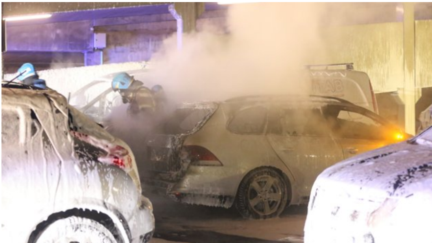
Flere biler i brann på Torp