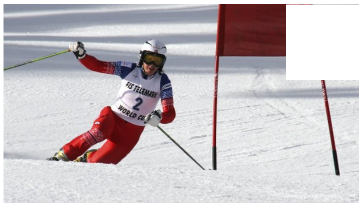
På pallen i verdenscupåpningen