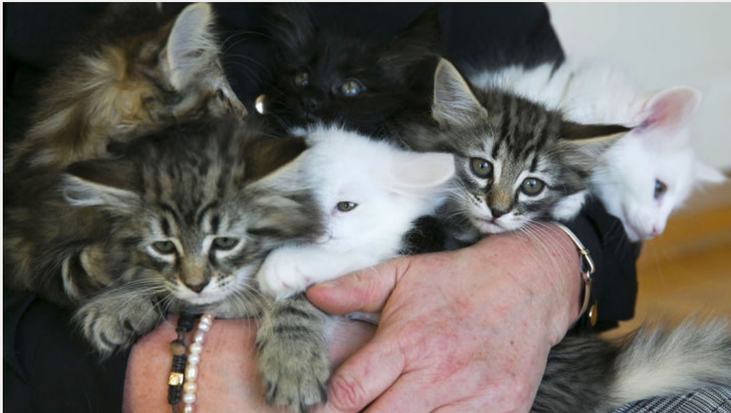
TRYGGE: Kattungene til Eva Dahl Eide får alt de trenger av matmor.

Busuttil ga bort kattungene da de var åtte uker gamle.