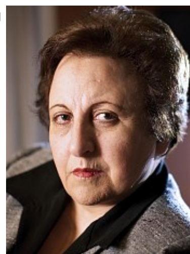
Nobelprisvinner Shirin Ebadi fra Iran mener det er brudd på menneskerettighetene å ikke få seksualundervisning.