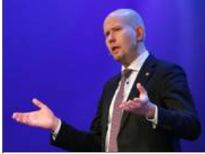
Fornybar vannkraft for nye generasjoner