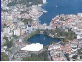
Nytt teater for byen