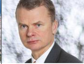
«Indvandring» et fy- eller plussord i innspurten av den danske valgkampen?