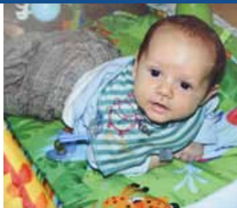
August døde efter 8 uger