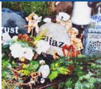
Eliasz døde ved fødslen