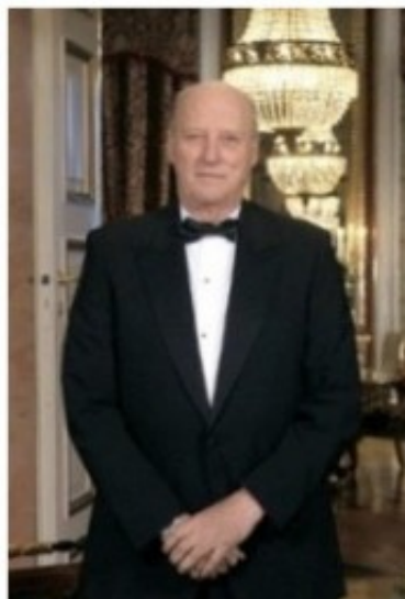
Kongen ba i sin nyttårstale 2014 folket om å ikke mobbe hverandre ved bruk av internett.

Den aktuelle psykologen fungerer fortsatt som psykolog, og påtar seg oppdrag for domstolene og fylkesnemndene i sørnorge. Det ligger i sakens natur at han ikke gjør dette i saker hvor vårt kontor yter bistand.