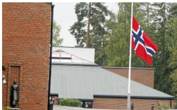
STENSBRÅTEN SKOLE: Flagget vaier på halv stang på Stensbråten skole hvor 2 av de drepte jentene fra Mortensrud gikk.

Hendelsene ryster ikke bare nærmiljøet, men hele Norge. Barn får med seg mer enn du tror, og kan bli skremt av å høre om andre barn som er blitt drept av pappaen sin . Og de siste årene har de dukket opp med jevne mellomrom. Ifølge VG er 33 barn under 15 år drept eller mishandlet til døde av sine foreldre i Norge. Tallene ble innhentet før tragedien på Mortensrud, der en mann er mistenkt for å ha drept sin kone, deres tre barn og seg selv .