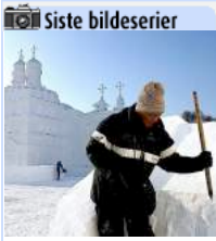
ISKALDT I HARBIN