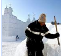
ISKALDT I HARBIN